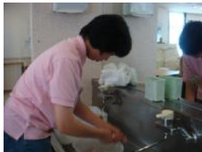
○企業 介護施設でふきん絞りをしました。