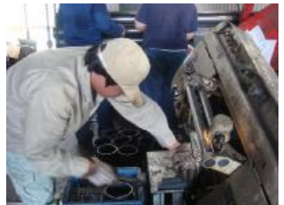
○企業 機械で金属加工をしました。