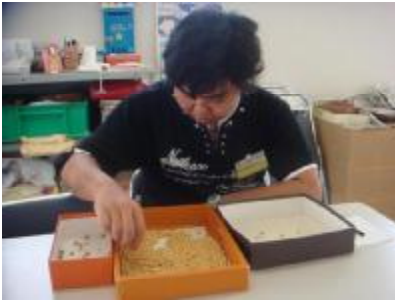
○授産施設 豆の選別をしました。

卒業後の進路先になる可能性のある場所での校外実習を行いました。今回の実習を受けて、夏休みの個別懇談で今後の方針を決めていきます。