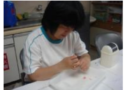
○就労継続支援B型 ビーズアクセサリーを作りました。