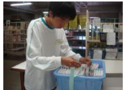
○企業 バーコードを貼りました。