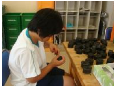
○就労移行支援 バリ取りをしました。