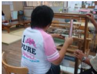
○作業所 織物をしました。