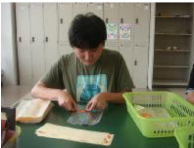
○生活介護 シール貼りをしました。